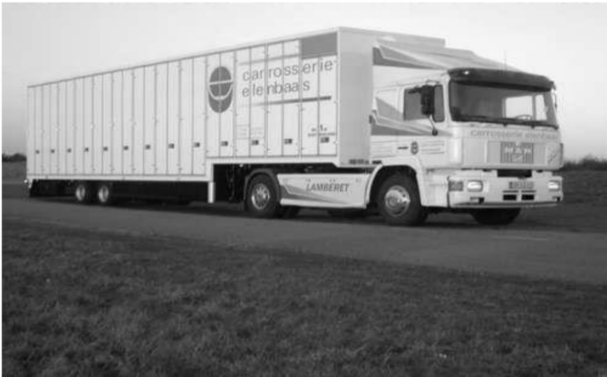
Vrachtwagen van Afdeling 10 Noord Oost Nederland