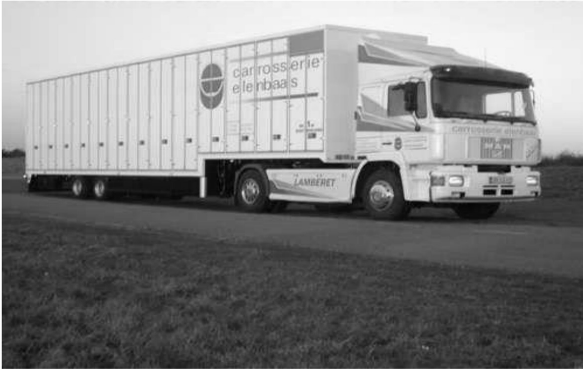
Vrachtwagen van Afdeling 10 Noord Oost Nederland